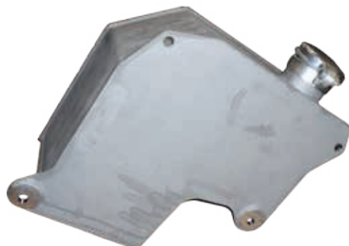
Réservoir à huile

Ø : 200 mm - Hauteur : 50 mm - Poids : 3 kg