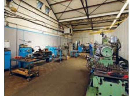
Atelier de tournage conventionnel