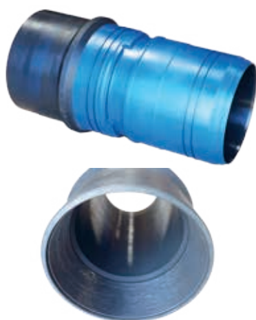
Body tieback tool

Issue d'une production en série, cette pièce, a été usinée sur notre nouveau centre de tournage CN horizontal : le DOOSAN PUMA 700 LM.