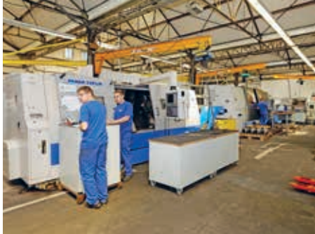
Atelier de tournage à commande numérique