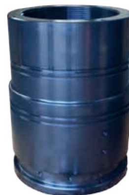
Body upper connector

Ø : 400 mm - Hauteur : 540 mm - Poids : 160 kg