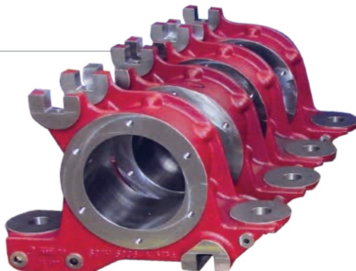
4 Corps de boîte d'essieu

Longueur : 500 mm - Largeur : 400 mm Hauteur : 200 mm - Poids : 80 kg