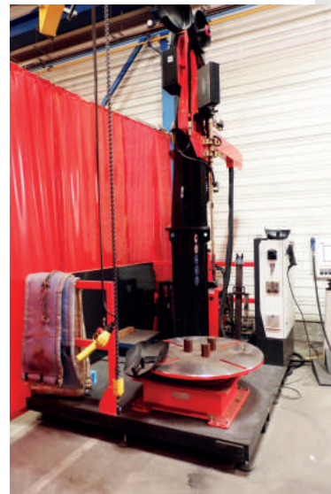
Nos procédés en cladding