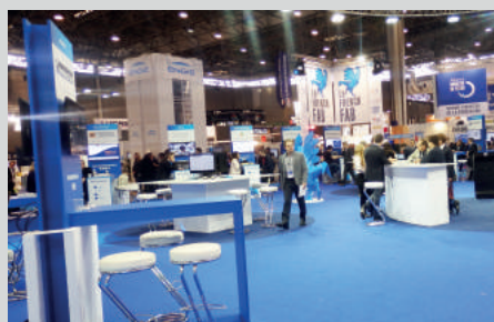
La French Fab à laquelle CRM est fière d'appartenir