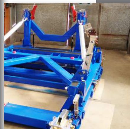
L'assemblage d'un châssis complexe